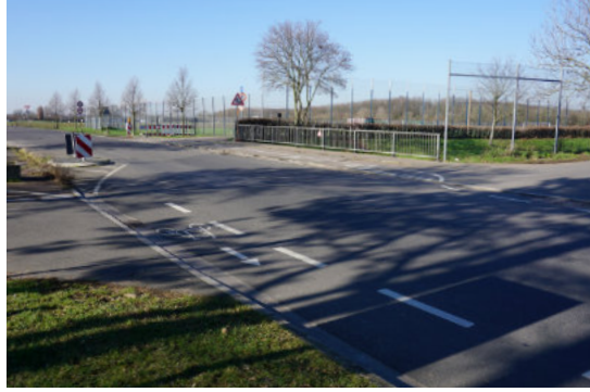
Verkehrssituation an der Stommelner Straße in Höhe des Randkanals

Sobald dazu Rückmeldungen von der Verwaltung vorliegen, wird die CDU Sinnersdorf darüber informieren. ■